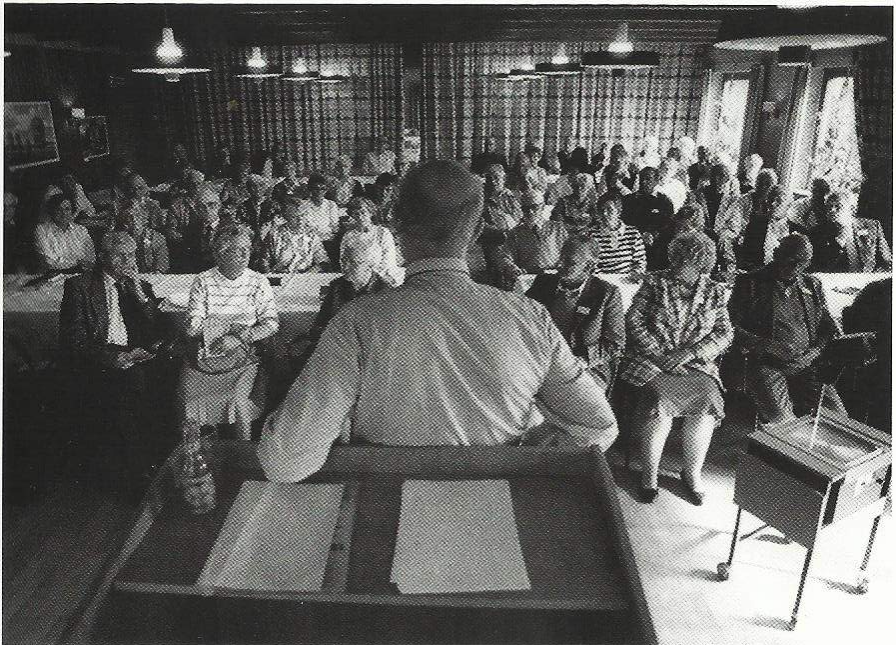
Billede fra de første "Højskoledage" 1987.

I begyndelsen var der fin tilslutning, men i de senere år er interessen ikke så stor, blandt andet fordi, det er blevet dyrere. Der er større konkurrence og endelig skal AB-skolen, som den hedder, være en selvstændig afdeling af foreningen.