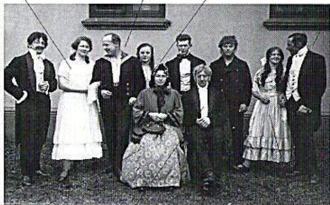
"Sparekassen" - 1925.