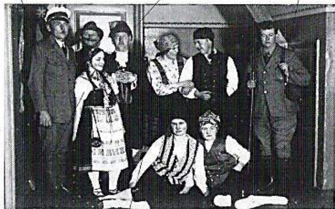
"Til Sæters" - 1929.