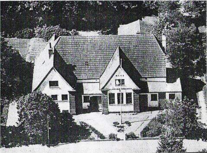
"Slogs Herreds Hus" 1936.

Desuden var der rejsende biograf én gang om måneden for 1 krone.