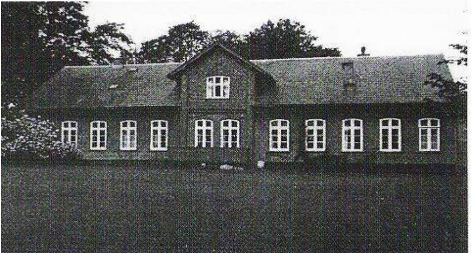
Bylderups Sogns præstegård frem til 1982. Opført efter en brand i 1875.