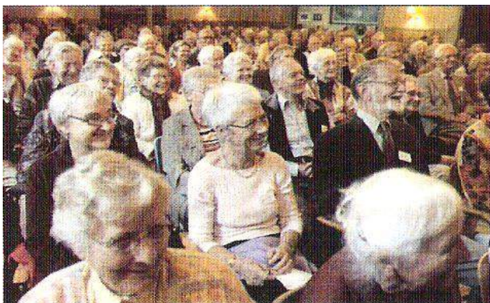
Billede fra de sidste afholdte "Højskoledage".